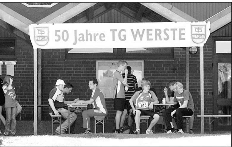
Ruhepause: Am Sportlerheim konnten sich die Aktiven zwischen den Wettkämpfen bei einem kleinen Imbiss stärken.